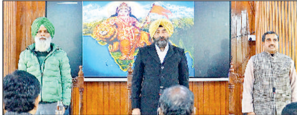
सोनीपत। कार्यक्रम के दौरान उपस्थित प्रतिनिधिगण।