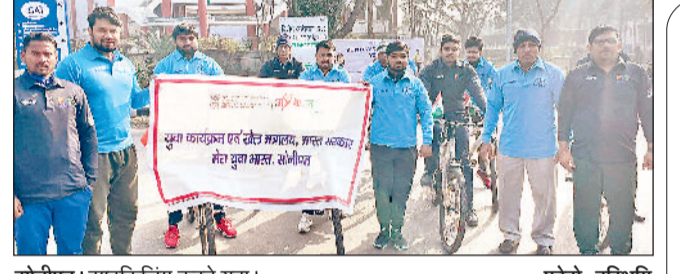
सोनीपत। साइकिलिंग करते युवा।