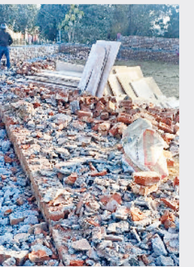
सोनीपत। महाराजा सूरजमल स्मारक स्थल पर गिराई गई दीवार।

समाज के कुछ लोगों ने स्मारक स्थल की दीवार गिराने के लिए लक्षित विरोध जताया है। उनका कहना है कि पूर्व में बनी संरचना को हटाने की आवश्यकता नहीं थी। समाज के एक प्रतिनिधि ने बताया कि इस तरह की कार्यवाही प्रशासनिक अधिकारियों के कहने पर की गई है। चुनावों को देखते हुए मौखिक आदेशों के तहत दीवार गिराई गई है। जिसके कारण इस तरह से दीवार गिराने के मामले में कई सवाल खड़े किए जा रहे हैं।