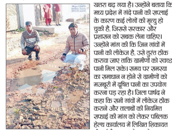
जिन तालाबों पर खर्च किया गया था, उनकी हाजत भी खराब है। पब्लिक हेल्थ विभाग के अधिकारियों ने समस्या के शोध समाधान का आश्वासन दिया है।