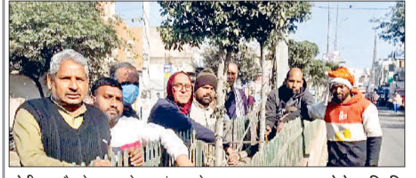
सोनीपत। पौधारोपण करते हुए संगठन के सदस्य।