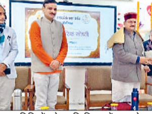
गोहाना। अतिथियों को स्मृति चिह्न भेंट करते हुए मेजबान।